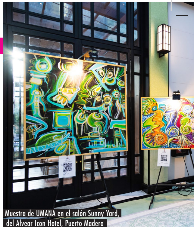
Muestra de UMANA en el salón Sunny Yard, del Alvear Icon Hotel, Puerto Madero

Sos la artista más innovadora e inesperada del